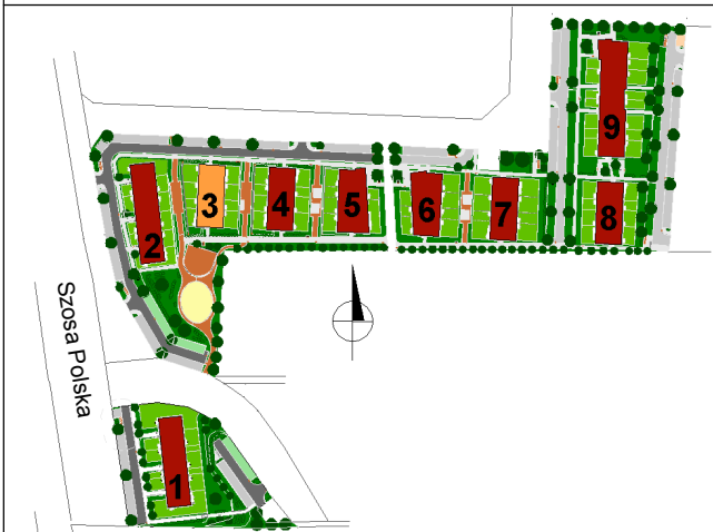
SCHEMAT ROZMIESZCZENIA MIESZKAŃ BUDYNKU nr 3