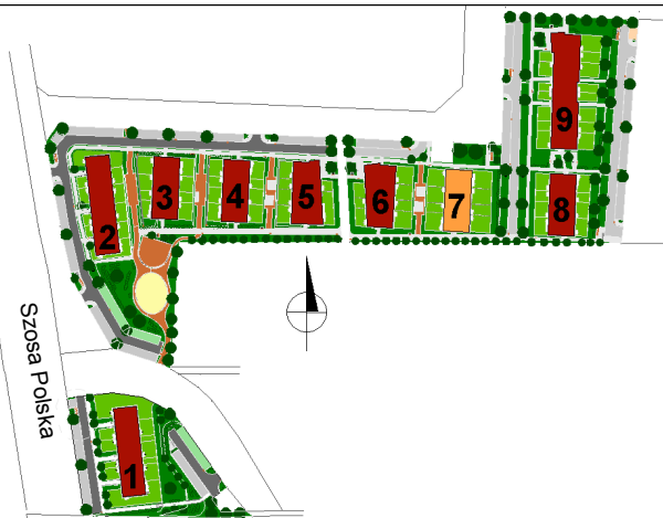
SCHEMAT ROZMIESZCZENIA MIESZKAŃ BUDYNKU NR 7